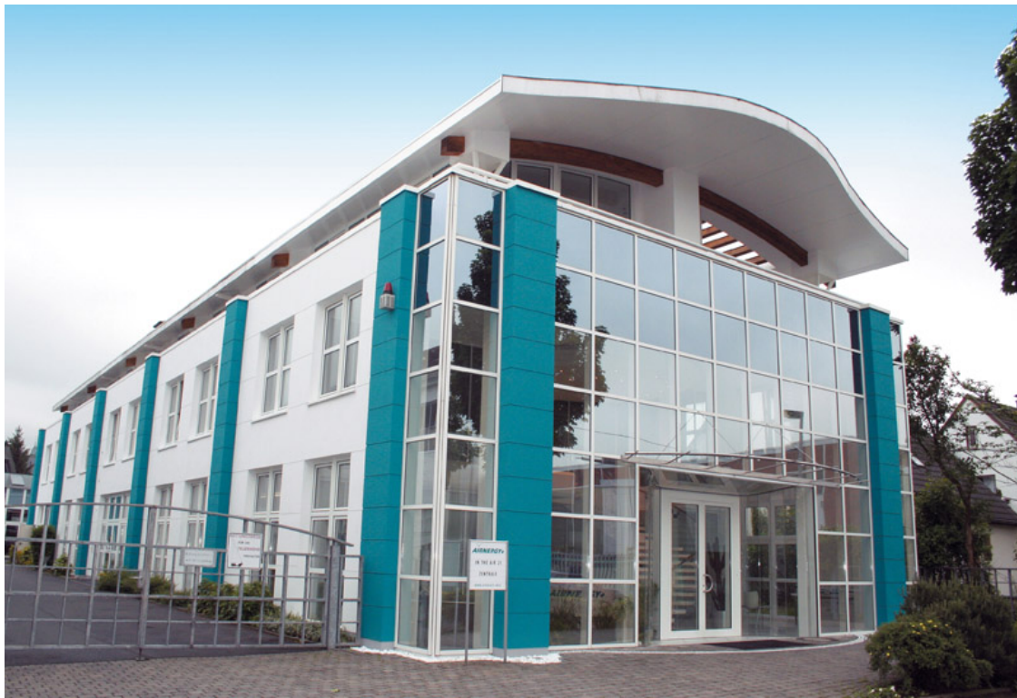
Die Airnergy Zentrale in Hennef

explizit aufgeführt und auf den Airnergy Luftkurort hingewiesen wird. Das erinnert an das damals noch eher außergewöhnliche Ausstattungsmerkmal Klimaanlage, wie es bereits vor Jahrzehnten seinerzeit eingeführt wurde und heute in vielen Haushalten als selbstverständlich gilt.